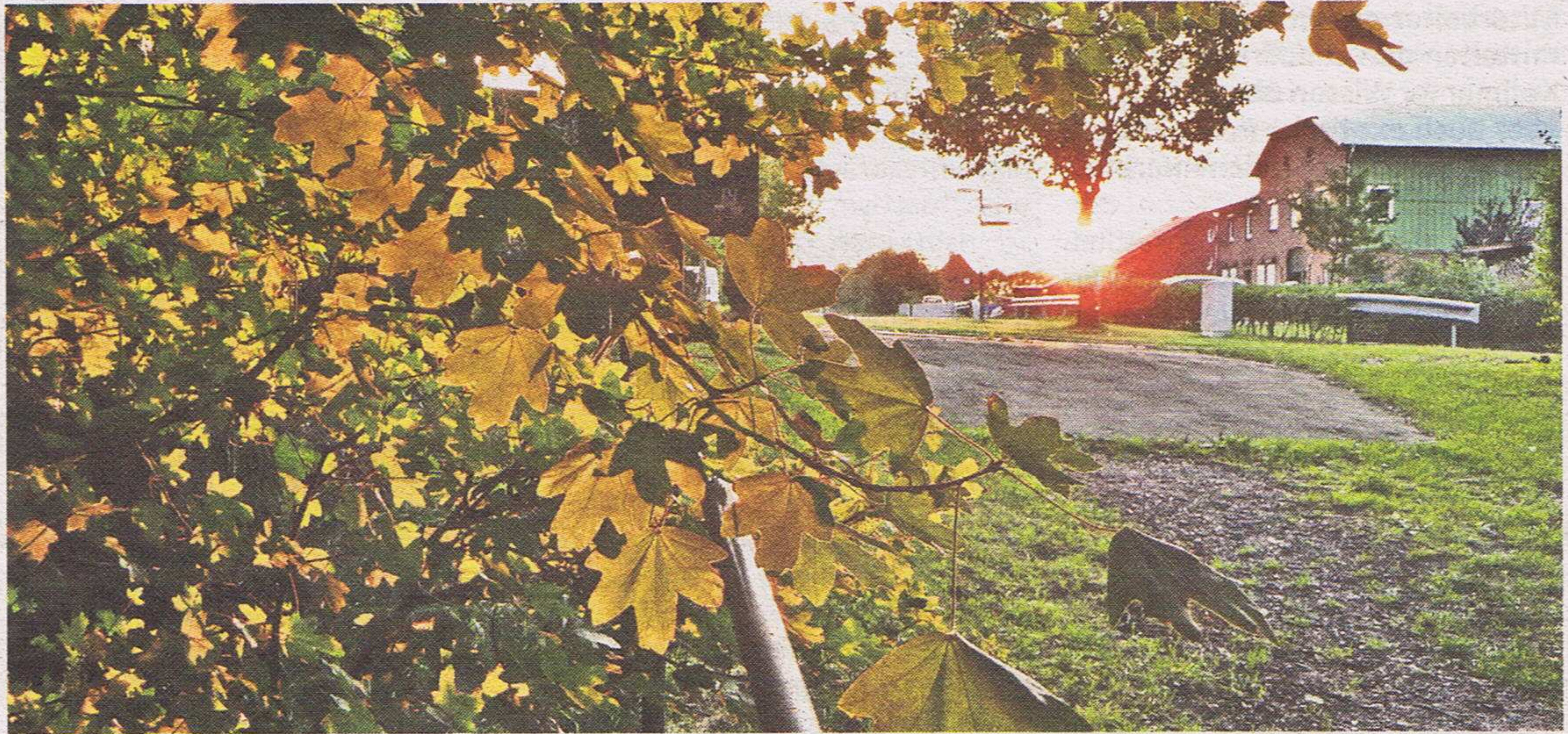
Herbstlaub im Licht.

Mit der digitalen Kamera können auf Reisen und Veranstaltungen ganz bequem Fotos gemacht werden, beim späteren Betrachten stellen sich diese aber oft als nicht ansprechend und langweilig heraus. „Wie kann ich einfach gute Fotos machen?“ – das fragten sich auch zehn LandFrauen mit zehn verschiedenen Kameras aus Neumünster und Umland. So luden sie die Mediengestalterin Sabine Roth aus Rendsburg ins Bürgerhaus nach Ehndorf ein.