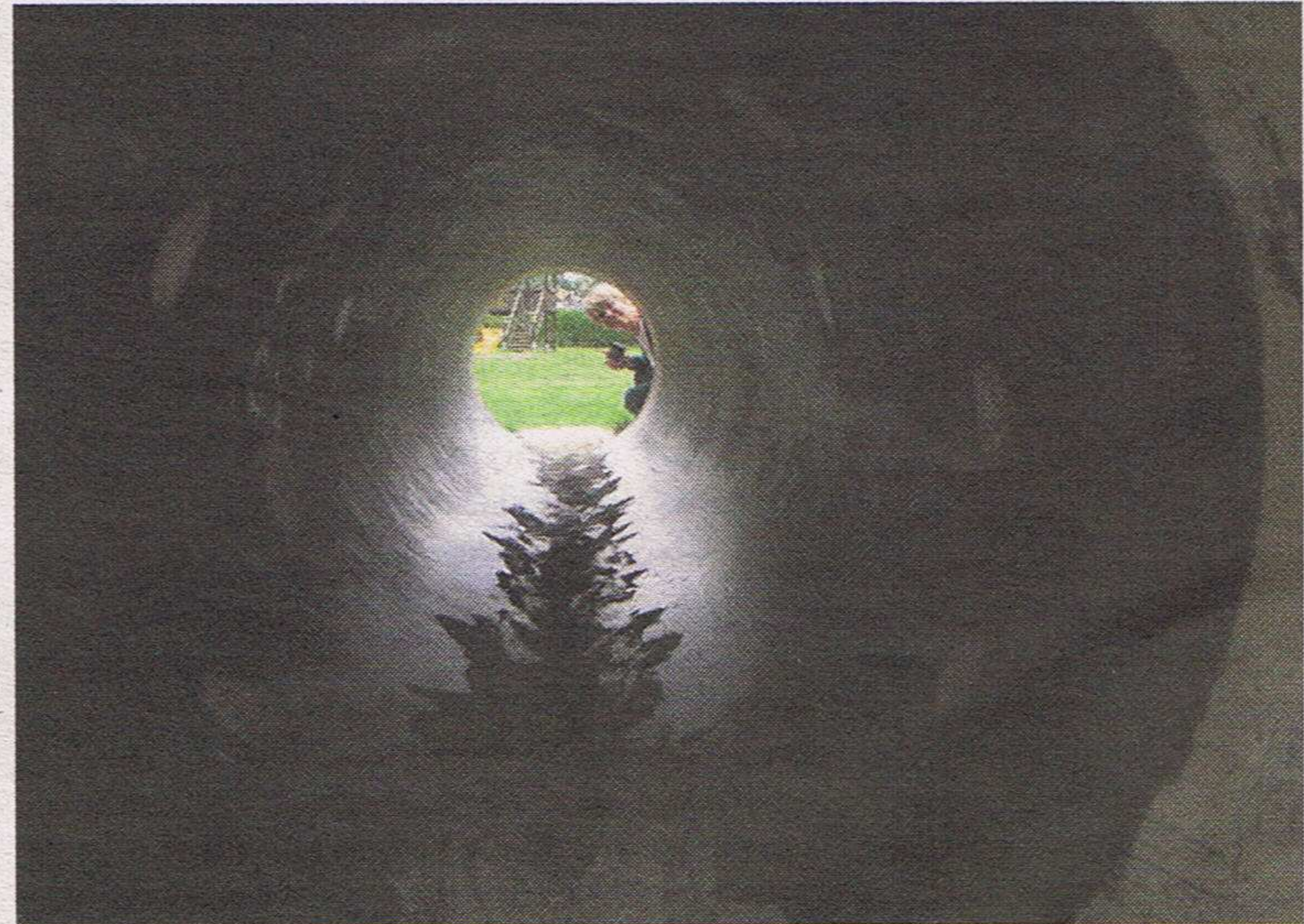
Der Blick durch ein Rohr – künstlerisch festgehalten.